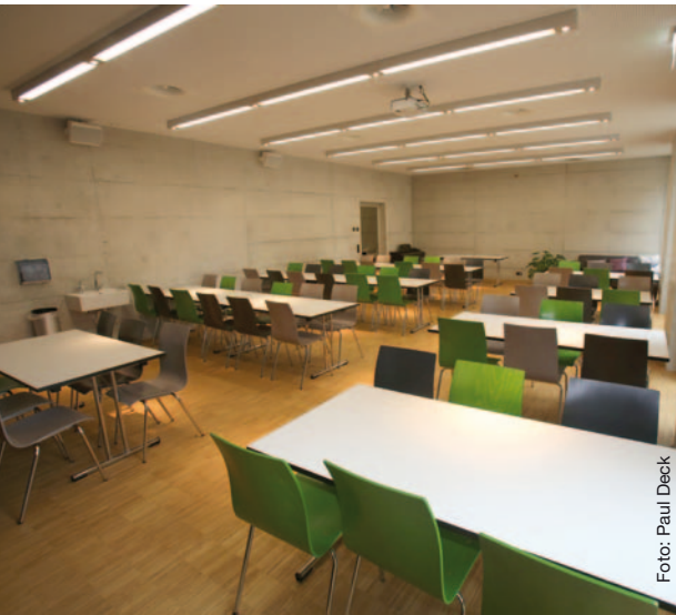
▲ Die sachliche Atmosphäre in dem Seminarraum unterstreichen die Deckenanbauleuchten Channel.

sige Hauptvolumen mit Attikageschoss steht präsent an der Theaterstrasse, dahinter liegt nahe der Bahngleise in einem niedrigeren Baukörper der große Saal.